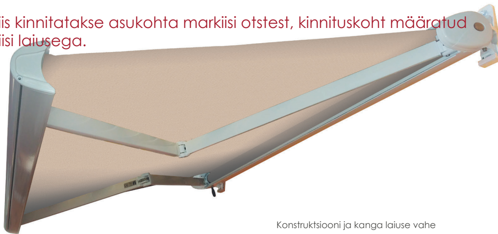
Konstruktsiooni ja kanga laiuse vahe