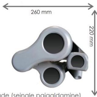
Külgvaade (seinale paigaldamine)