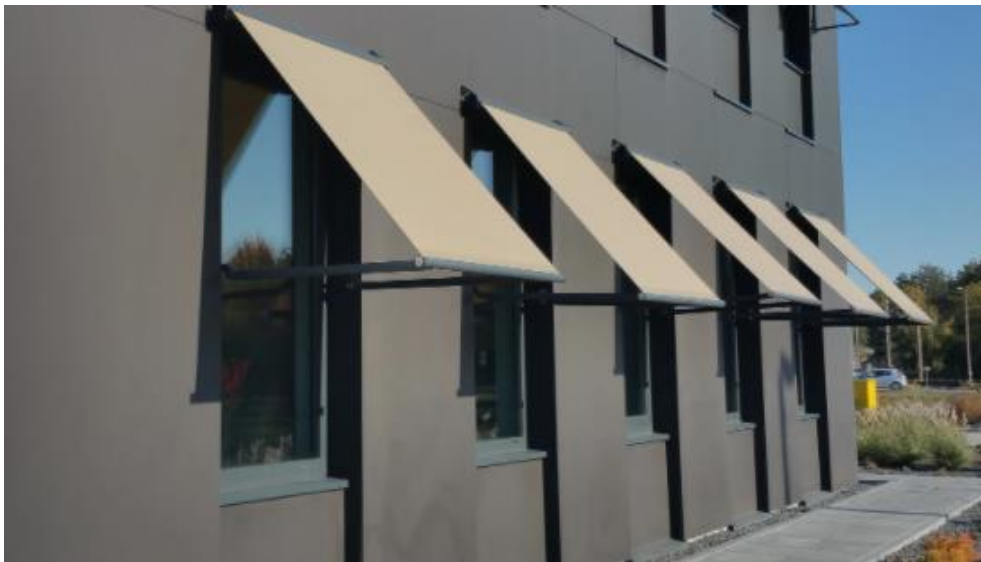
Külgtoe külgliseina kinnitus