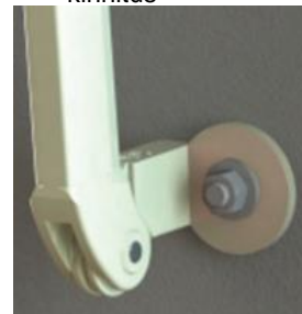
Külgtoe otsaseina kinnitus